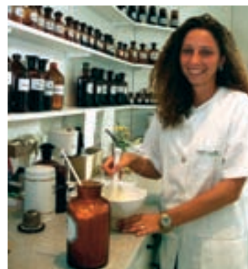
Progesteronhaltige Cremes können, nach Rezept, günstig in der Apotheke hergestellt werden

Warum aber eine Creme? Weil damit die Leber umgangen – und nur etwa ein Zehntel der Menge nötig ist, die gebraucht wird. Hormone wie Progesteron und Östrogen sind fettlöslich und hautdurchlässig. Das weiß man bereits von den Hormonpflastern. Deshalb ist es sehr einfach, sie in eine neutrale hautverträgliche Creme einzurühren. So gelangt das Progesteron rasch in den