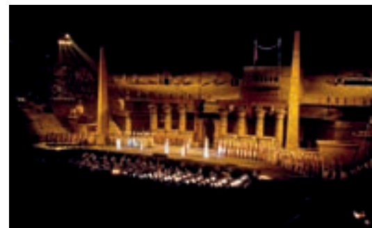
Wenn Hitzewallungen so heftig sind, dass man sich nicht einmal mehr ins Theater wagt, ist es höchste Zeit, sich einem kundigen Therapeuten anzuvertrauen