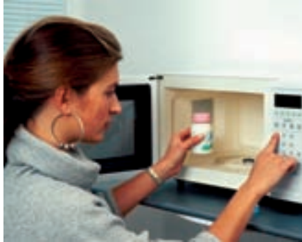
Plastikgeschirr und -flaschen, aus Erdöl hergestellt, können bei Erwärmung so genannte Xeno-Östrogene abgeben

durch Bluttests also nicht wirklich möglich. Man macht deshalb zusätzliche Bestimmungen wie viele „Transportvehikel“ (SHBG = sexualhormon binding globulin) vorhanden sind und rechnet dann aus, wie viele Hormone in freier Form vorliegen. Diese sind dann die momentan im Körper wirksamen Hormone. Höchst kompliziert!