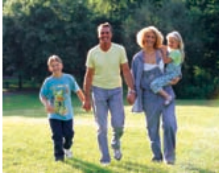
Die Hormon-Balance ist von vielfältigen Faktoren abhängig: Vererbung, Ernährung, Bewegung, Umweltgifte, spielen eine Rolle. Aber auch, ob eine Frau Kinder geboren hat